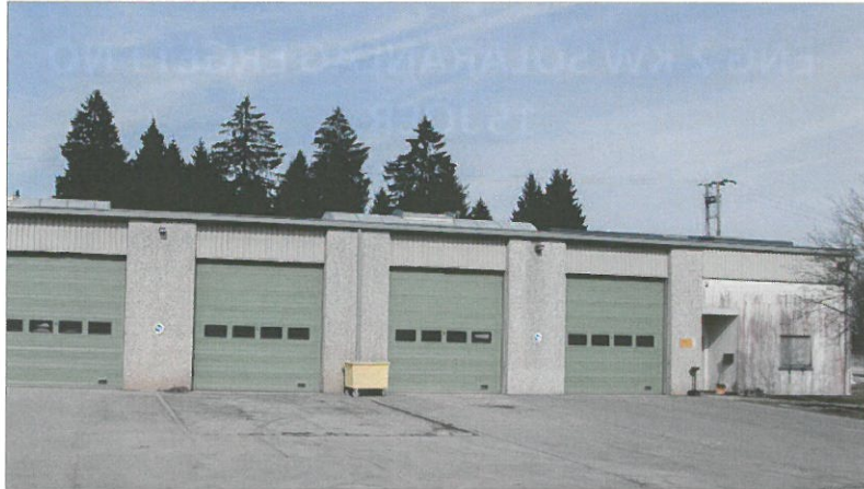
Um Atelier vum Riesenhaff zu Kietscht léien och 30 kW