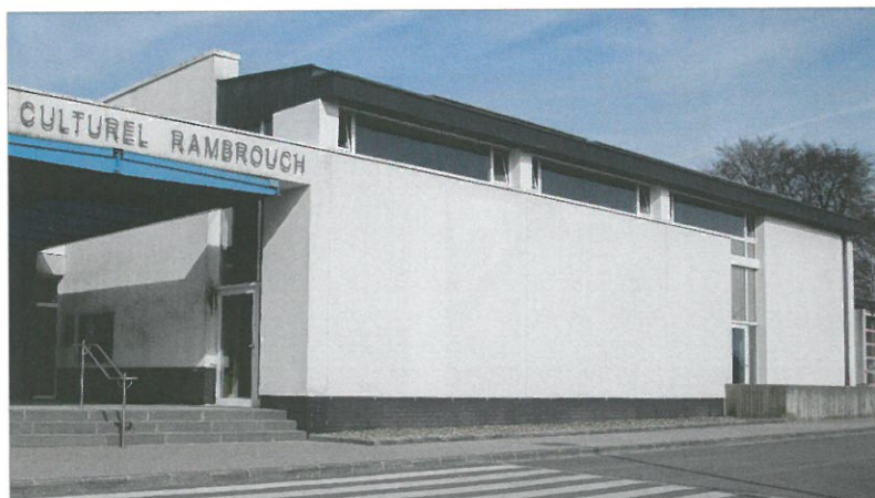
Um Daach vum Centre Culturel vun Rammerich lait eng Anlag vun 30 kW

Insgesamt hunn 15 Bierger aus eiser Gemeng sech akaaft. Di installéiert Leeschtung léien zwësche 25.50 kW (Päerel) an 30 kW (Riesenhaff a Rammerich).