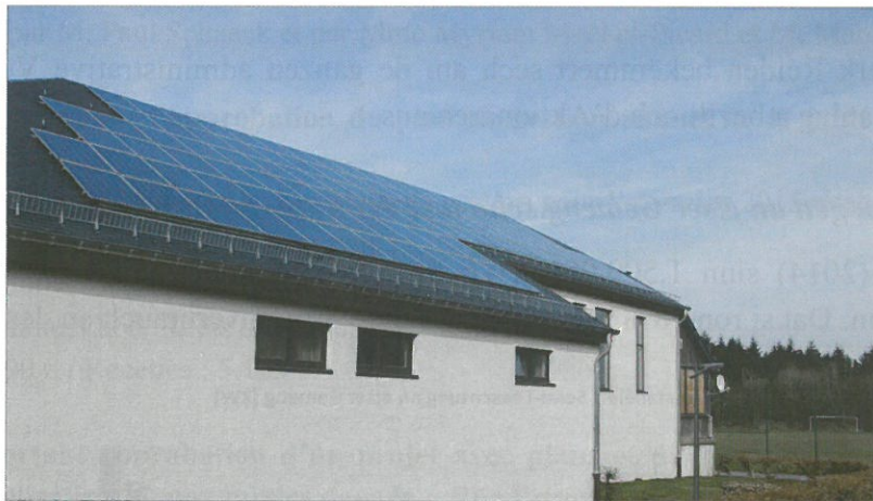
Zu Pärrel um Centre Culturel sin 25,5 kW installéiert gin

Insgesamt sinn sou 85,5 kW Leeschtung installéiert ginn, wat enger Stroum-Produktioun vun 76'950 kWh/Joer entsprécht – ronn de Verbrauch vu 15 Haushälter aus eiser Gemeng!